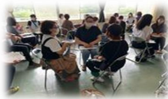
那須烏山市立境小学校 「子どものほめ方・しかり方～思春期と自己肯定感～」