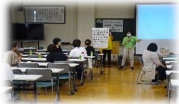
矢板東高等学校附属中学校 「中学生・思春期はこんな時期です！」